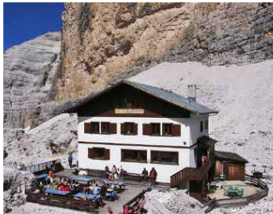
Il rifugio Giussani, situato a Forcella Forcella Fontananegra, nel Gruppo delle Tofane, a 2.580 m s.l.m., festeggerà i 50 anni dalla costruzione

Il 19 giugno il ritrovo per soci e simpatizzanti sarà al rifugio Dibona. Da qui si formeranno dei grup-