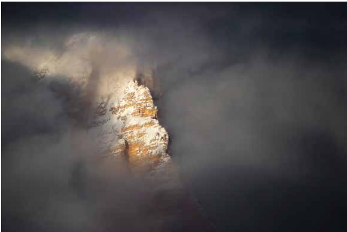
CRISTALLO FRA LE NUBI (foto e testo di Marco Migliardi)

Spesso la gente si lamenta delle nuvole in montagna. Impediscono l'abbronzatura, nascondono lo spettacolo delle più alte vette, portano il freddo e a volte la pioggia. Ma quando si accostano alle montagne, si insinuano nelle loro gole e quasi sembrano giocare con le rocce che fanno capolino tra un cumulo e l'altro; non ci resta che seguire ammirati il loro perpetuo moto che ridisegna in continuazione i ben noti profili del nostro orizzonte