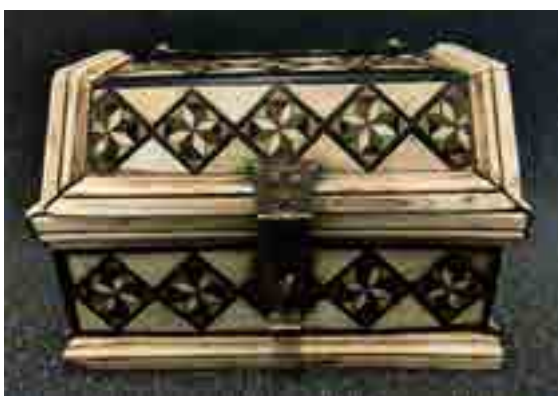
Cofanetto in osso ed essenze lignee, XV secolo, osso e ebano, collezione privata Fabbri Arte

Nella sala al piano terra sono affiancati importanti quadri di ritratti d'autore datati dal Cinquecento al Novecento che raccontano lo stile e l'eleganza femminile. Assieme ai ritratti vi sono esposti gioielli della scuola orafa di Padova, ma vi trova spazio anche la filigrana, sia come lavorazione del vetro come avviene a Murano, sia come lavorazione dell'argento secondo la tradizione ampezzana.