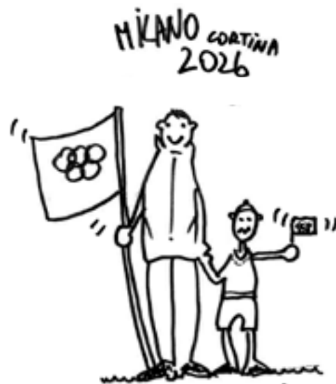
CONSEGNATA LA BANDIERA