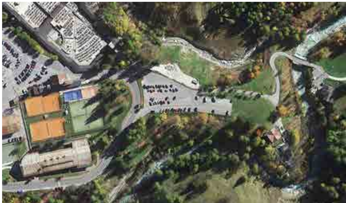
Sopra: la proposta di partenariato pubblico/privato avanzata da Pool Engineering e Quick no problem parking del nuovo parcheggio in località ex Polveriera, con partenza di un nuovo impianto verso Socrepes. Sotto: la situazione attuale della zona interessata all'intervento