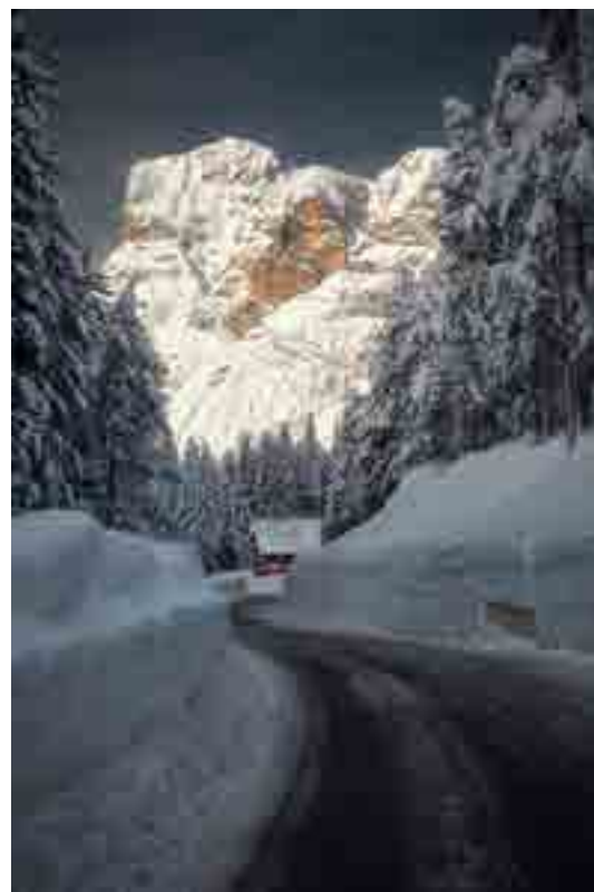
LA CASA CANTONIERA (foto e testo di Marco Migliardi)

Quest'anno le abbondanti nevicate hanno innalzato dei veri e propri muri lungo le nostre strade, dando l'impressione agli automobilisti di percorrere lunghe e profonde trincee d'asfalto che, con gli abeti carichi di neve, fanno da splendide quinte (quasi) naturali alle cime dolomitiche: Sass de Stria, Croda da Lago e Tofana lungo il Falzarego, Cristallo, Croda Rossa e Taè-Taburlo (nella foto) lungo l'Alemagna tra Cortina e Dobbiaco.