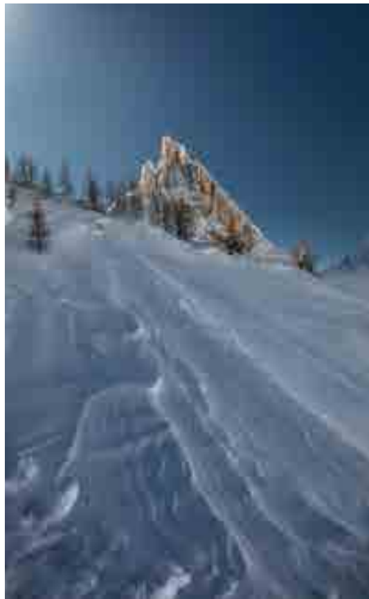
SASS DE STRIA (foto e testo di Marco Migliardi)

Elegante guglia che si eleva per circa 300 metri sopra il passo Falzarego, il Sass de Stria è una montagna molto fotografata dagli appassionati nonostante le sue modeste dimensioni, a causa della sua posizione isolata e dominante che durante la Prima Guerra Mondiale venne proprio per questo sfruttata dagli Austriaci per predisporre un importante avamposto di fronte alle prime linee italiane del Piccolo Lagazuoi.