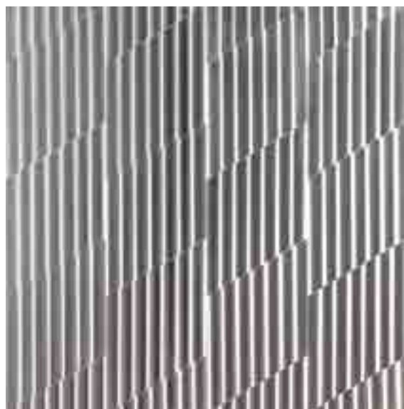
Superficie a testura vibratile, modulo diagonale "b", alluminio, 1971

Ideatore plastico, progettista, grafico, teorico, collezionista e attivo promotore, Alviani nasce a Udine il 5 settembre 1939. Già a partire dalla fine degli anni Cinquanta Alviani realizza le sue prime "superfici a testura vibratile", lavori in cui modella piani metallici fresati in acciaio e alluminio creando complessi e inediti giochi di riflessi che danno origine a illusioni ottiche e immagini diverse a seconda del punto di vista da cui le si osserva. Considerate una delle vette più alte della cosiddetta arte cinetica o programmata, nella quale le opere si originano non dall'impulso gestuale dell'artista, ma da un'esatta programmazione, Alviani stesso spiega che «ognuno di questi oggetti non assume validità per il fatto compositivo, non ha alcuna importanza la presenza in essi di una forma piuttosto che di un'altra, e si deve dire che tutti, anche i più differenti, sono il medesimo oggetto». La mostra propone undici lavori realizzati tra gli anni '60 e '70, periodo intenso della sua attività di "ideatore plastico", in cui giunge al culmine il suo interesse nei confronti di un approccio all'arte orientato al fare mediante la costruzione dell'oggetto attraverso la combinazione di forme e colori. Un metodo architettonico verso la creazione artistica che fonde la materialità dell'oggetto con la mutevolezza della luce.