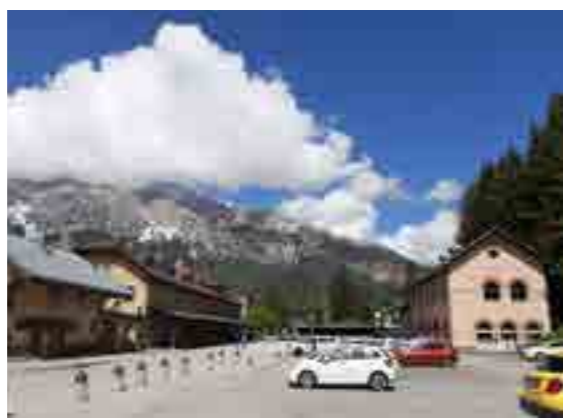
Sopra: l'ex stazione ferroviaria oggi; a fianco: vista del fronte Nord dei nuovi fabbricati residenziali (render)

L'Amministrazione comunale ha accettato tutto, anche di cedere un intero edificio già in servizio allo