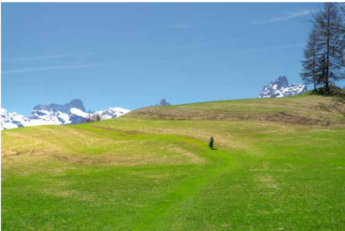
IN BICI SUI PRATI DI CADIN DI SOPRA (foto e testo di Marco Migliardi)

Da corsa o mountainbike, con ammortizzatori o senza, tradizionale o a pedalata assistita, comunque l'abbiate, questo è il momento di tirarla fuori dal garage e di metterla in strada! E' finalmente primavera anche in montagna, la stagione ideale per la bicicletta, per togliersi la ruggine dell'inverno e dei lockdown e riprendere a muoversi nella natura in modo divertente, ecologico e rilassante, magari schivando gli ultimi accumuli nevosi e approfittando dell'erba bassa dei prati per alcuni free ride che danno il senso della libertà finalmente riconquistata.