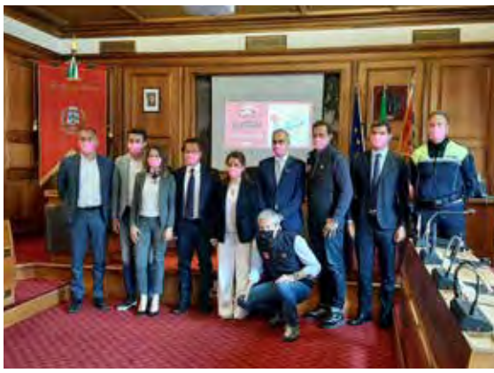
Il Comitato di tappa Sacile-Cortina in sala consiliare del Comune di Cortina per la presentazione dell'evento