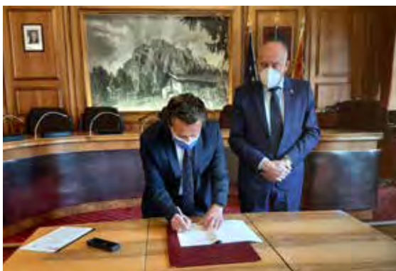
La firma del sindaco di Cortina assieme al presidente della Fondazione Dolomiti UNESCO per la nuova sede

Da corsa o mountainbike, con ammortizzatori o senza, tradizionale o a pedalata assistita, comunque l'abbiate, questo è il momento di tirarla fuori dal garage e di metterla in strada! E' finalmente primavera anche in montagna, la stagione ideale per la bicicletta, per togliersi la ruggine dell'inverno e dei lockdown e riprendere a muoversi nella natura in modo divertente, ecologico e rilassante, magari schivando gli ultimi accumuli nevosi e approfittando dell'erba bassa dei prati per alcuni free ride che danno il senso della libertà finalmente riconquistata.