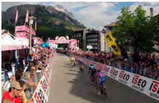
L'arrivo di tappa a Cortina nel 2012

Il programma potrà subire variazioni in base alle condizioni meteo.