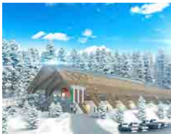
Fotosimulazione dell'edificio di arrivo del nuovo Sliding Center in programma per i Giochi del 2026

La vecchia pista "Eugenio Monti" è stata smantellata per dare spazio al nuovo "Sliding Center" dal costo di 124 milioni di euro - Iva esclusa - diviso in tre lotti: smantellamento impianto vecchio (primo lotto); costruzione nuova pista con nuova viabilità ed edifici a servizio (secondo lotto); memoriale storico culturale (terzo lotto). Completato - o quasi - il primo lotto, è stato indetto il Bando di gara per la realizzazione del secondo lotto del "Cortina Sliding Centre": all'apertura delle buste il 31 luglio, nessuna ditta si è presentata per effettuare l'intervento di 81.610.000 Euro (IVA esclusa), di cui 79.112.000 Euro per lavori