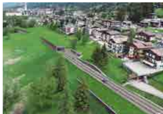
Fotosimulazione della bretella - variante ANAS SS 51 tra Cojana e la zona dell'ex Polveriera, sotto via Guide Alpine