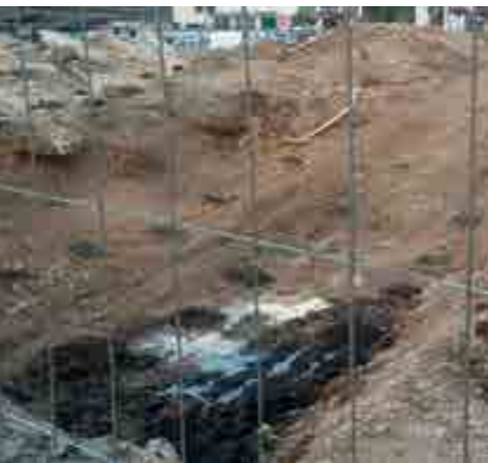
Sopra: l'acqua che emerse in largo Poste dopo aver scavato pochi metri per la bonifica bellica nell'aprile 2016, effettuata prima di partire con il cantiere per il parcheggio già ridimensionato su due piani, che poi non è mai partito

Estratto da: "La grande frana sui cui è sorta Cortina d'Ampezzo", di Mario Panizza e Rinaldo Zardini con la collaborazione di Massimo Spampini, Edizioni Dolomiti Cortina, luglio 1986.