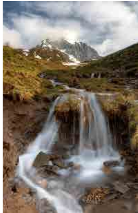
CERNERA - CASCATELLA (foto e testo di Marco Migliardi)

Ce ne sono a decine, forse a centinaia, di torrenti e torrentelli nelle nostre zone. Sono ottimi compagni di gita, ci accolgono e ci offrono refrigerio nelle giornate più calde, ci danno da bere a monte dei pascoli, ci presentano scenari grandiosi quando scavano il loro cammino in profonde gole e ci forniscono sempre l'occasione per scattare belle immagini a ricordo dei nostri giri nelle Dolomiti. Che montagna sarebbe senza i suoi corsi d'acqua?