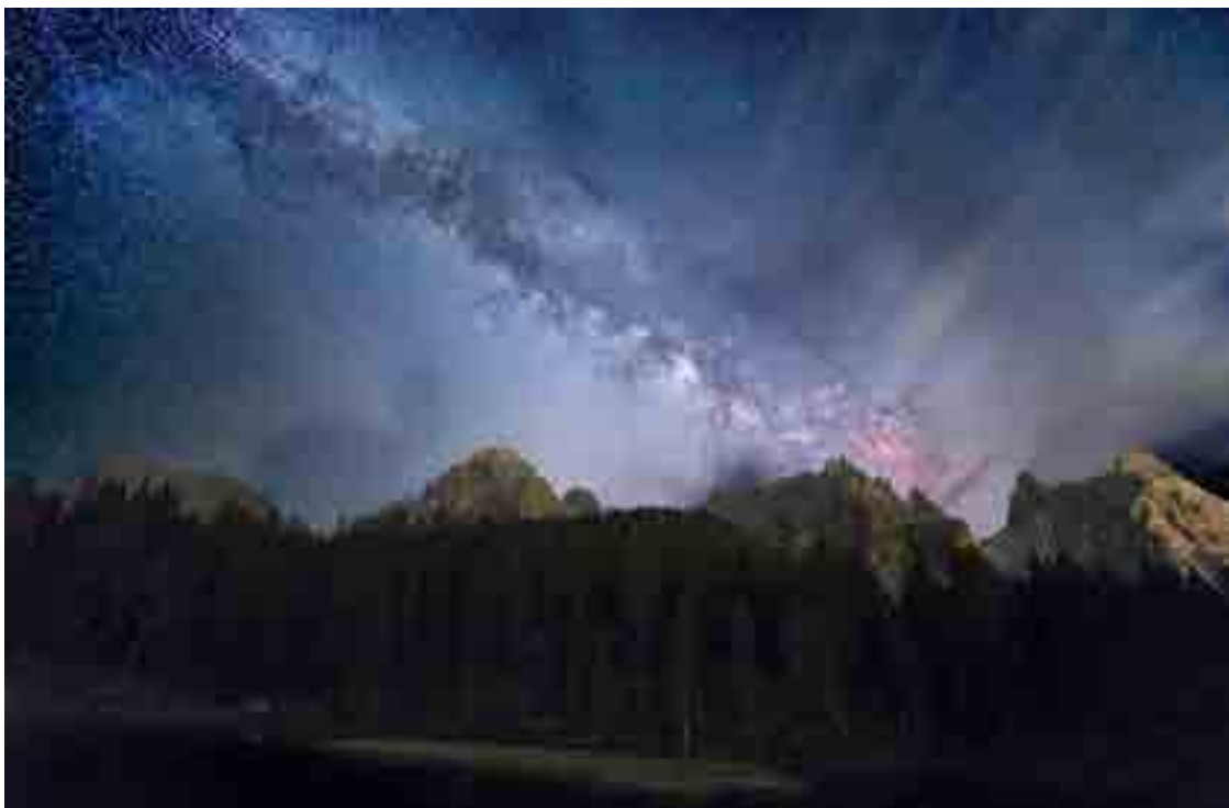
LA VIA LATTEA (foto e testo di Marco Migliardi)

In montagna, si sa, l'aria è più pura, l'inquinamento luminoso, non appena ci si allontana dai centri abitati, è quasi assente e questo genera ogni notte serena uno spettacolo cui il cittadino non è purtroppo più abituato: il cielo si riempie letteralmente di stelle e, nitida e chiara, appare distintamente la Via Lattea, la grande galassia che ci ospita insieme ad altre 400 miliardi di stelle e forse altri 5-6 miliardi di pianeti come il nostro. No, non siamo soli nell'Universo!