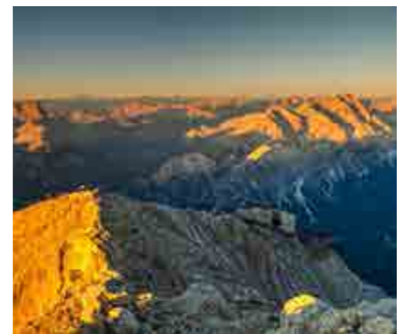
Tramonto da Cima Tofana.

ven 23 ago ► Yoga in quota: sulla terrazza panoramica di Capanna Ra Valles, dalle ore 9 alle 11. Al termine della lezione si potrà gustare uno spuntino. Costo: € 40, obbligatoria la prenotazione: tofanacortina@freccianelcielo.com; Tel: 393 2968627 - 0436 5052