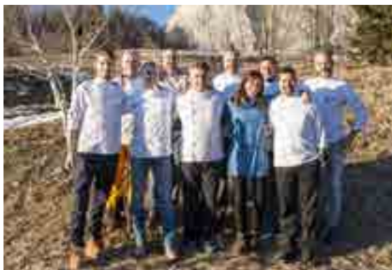
La squadra degli chef di The Queen of Taste