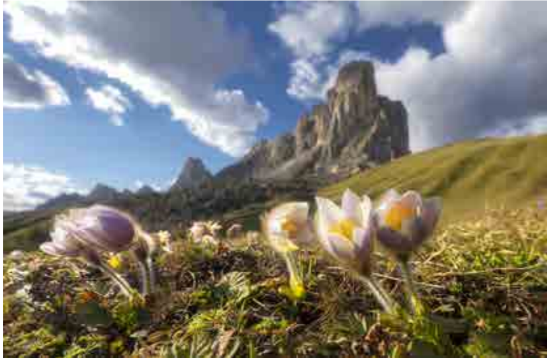
ANEMONI AL GIAU (foto e testo di Marco Migliardi)

Il nome scientifico è Pulsatilla vernalis anche se molti la chiamano comunemente Anemone di montagna. È il fiore che annuncia l'arrivo della primavera che in montagna, si sa, avviene a fine maggio, quando i prati e i pascoli d'altura, sciolte le ultime nevi, si ricoprono di queste splendide ranunculacee, che appaiono protette da una fitta peluria che le preservano dalle gelate.