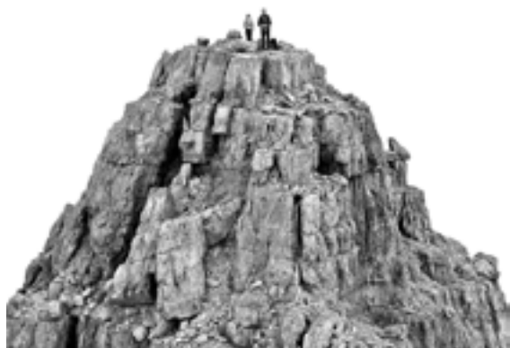
Olivo Barbieri: Dolomites Project, 2010

Un premio, il Lagazuoi Photo Award, che trova una casa di grande fascino a 2778 metri di quota, nella stazione di arrivo della Funivia Lagazuoi, per raccontare come gli autori contemporanei rappresentano il paesaggio, in particolare la montagna. La prima edizione, anno 2020, ha selezionato vincitore la serie Dolomites Project, di Olivo Barbieri, artista che alle Dolomiti ha dedicato una ampia serie di lavori fotografici e video.