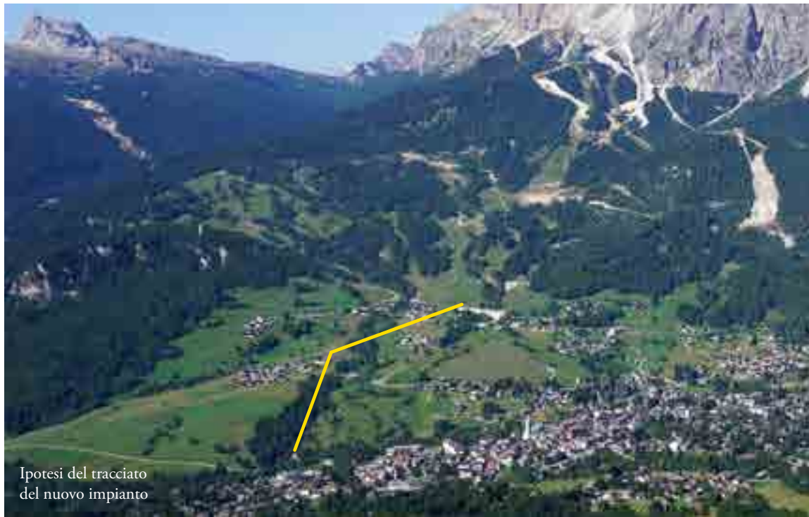
Ipotesi del tracciato del nuovo impianto