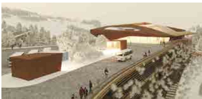
Render della stazione di partenza (lato ovest verso il torrente Boite)