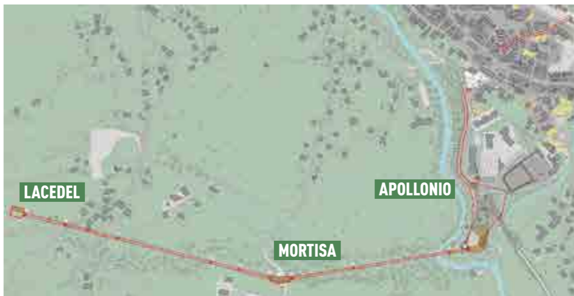
Planimetria di progetto con individuazione area di intervento

Zuel di Sopra 20A tel. 0436 866966 - 347 2410840 info@falegnamerialorenzi.com