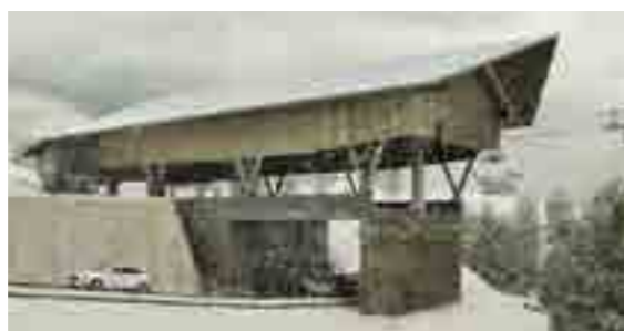
Stazione intermedia di Mortisa, da sud

prossimi alle aree di cantiere; rumore e vibrazioni in relazione alla possibilità che in fase di cantiere si rilevino superamenti dei limiti normativi, ancorché non particolarmente rilevanti, a carico dei ricettori prossimi alle aree di cantiere; paesaggio in relazione al paesaggio percepito in fase di cantiere". C'è tempo fino al 1 agosto per presentare osservazioni.