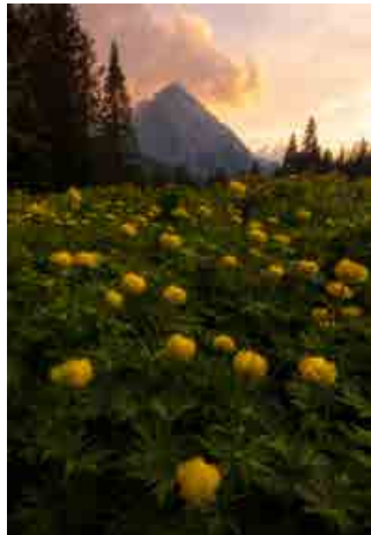
BOTTON D'ORO (foto e testo di Marco Migliardi)

Il nome latino, Trollius europaeus , evoca antiche divinità nordiche, ma il nome con cui è universalmente noto è molto più comune e quasi casalingo: Botton d'oro. Se ne trovano a migliaia nei prati più umidi d'alta montagna e si fa fatica a credere che tanta soave bellezza nasconda l'insidia di una sostanza velenosa ed irritante, la protoanemonina, che può provocare delle dolorose dermatosi. Quindi, a maggior ragione, non raccogliete questi fiori nei campi!