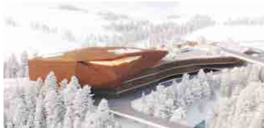
Render della stazione di partenza (lato est verso il torrente Bigontina)

I possibili principali impatti ambientali previsti dalla realizzazione dell'intervento riguarderanno, in base a quanto riportato nell'istanza della Pool Engineering: "suolo e sottosuolo in relazione alla possibilità, per quanto remota e improbabile, che in fase di cantiere si verificano fenomeni di dissesto; acque in relazione alla possibilità, per quanto improbabile che in fase di cantiere si verificano fenomeni di sversamento accidentale nei corpi idrici superficiali con alterazione della qualità delle acque superficiali; aria ambiente in relazione alla possibilità che in fase di cantiere si disperdano polveri ed inquinanti in atmosfera con effetti, ancorché non particolarmente rilevanti, a carico dei ricettori