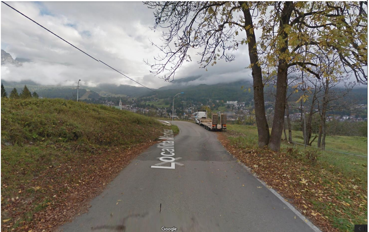
Strada Mortisa – Cortina in prossimità dell'incrocio per Meleres