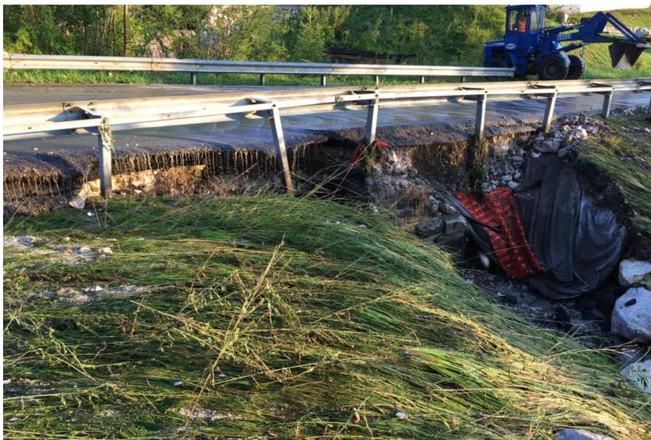
Danni alla Statale 48 delle Dolomiti