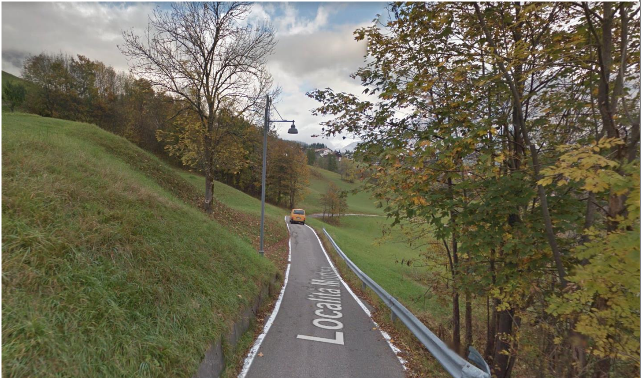
Strada comunale Mortisa - Col