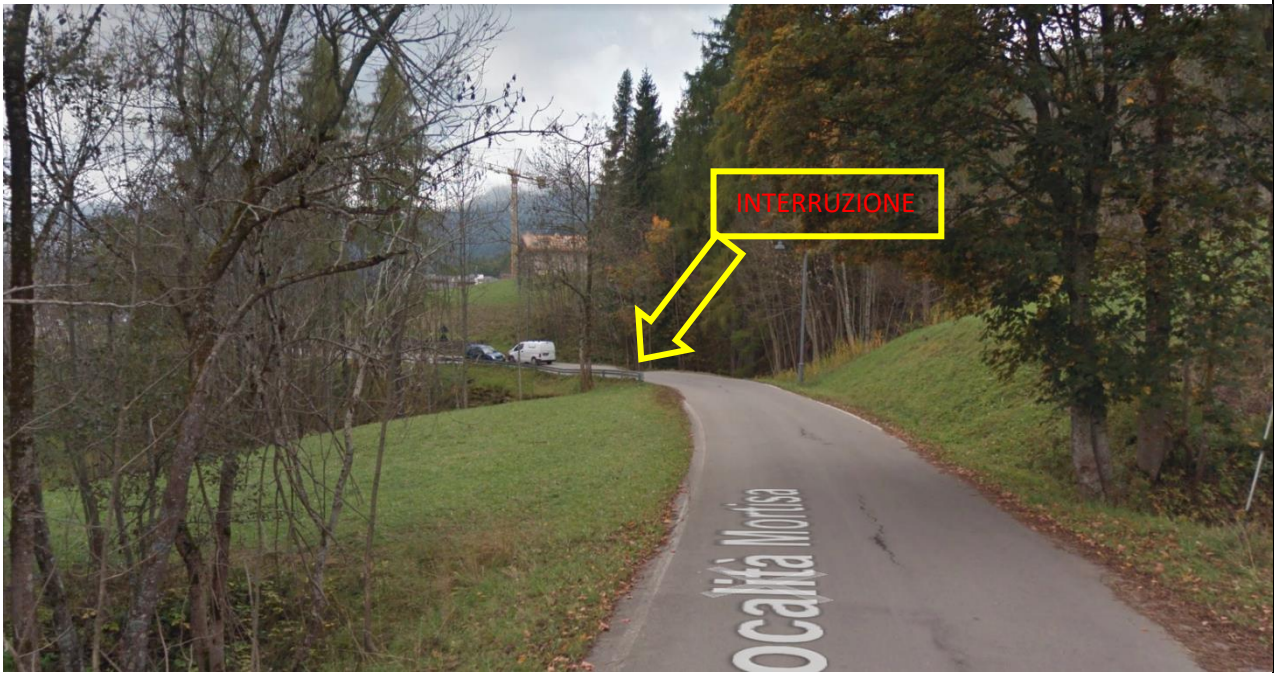
Punto dove la strada si è interrotta A CAUSA DELL'EVENTO DEL 30/07/2018