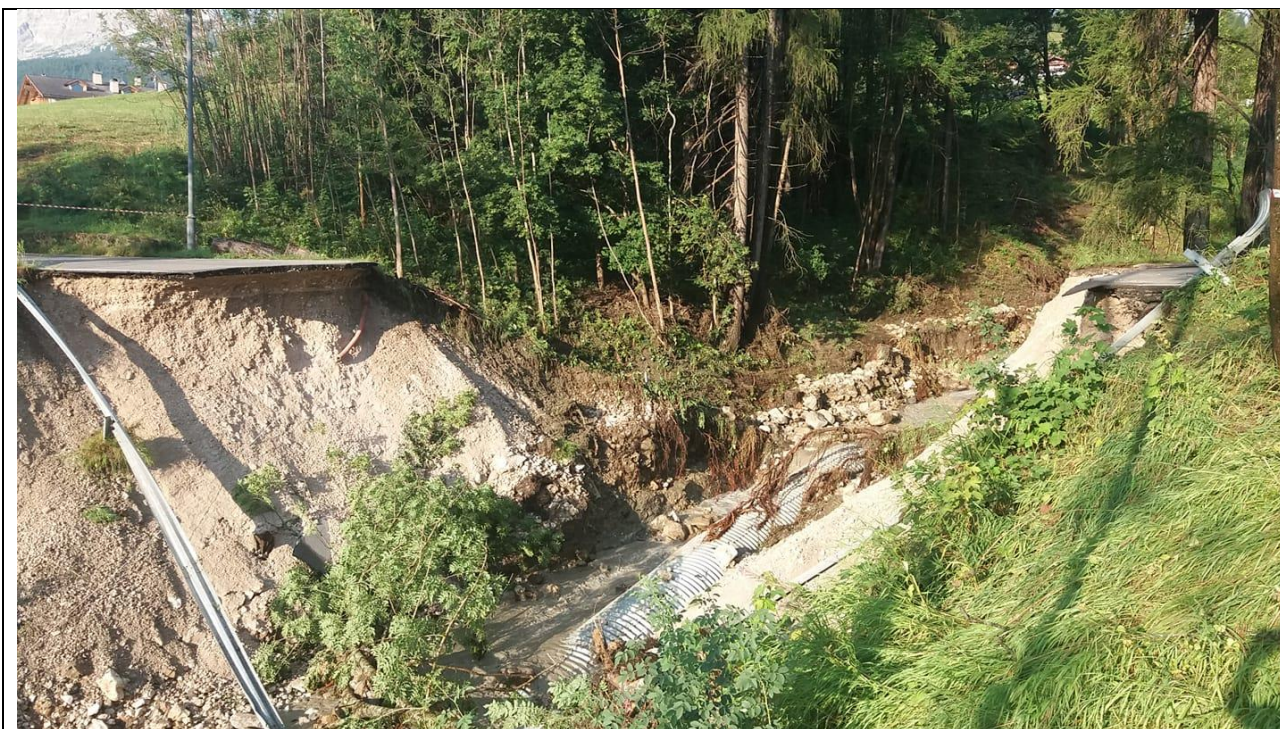
Tratto di strada Mortisa-Cortina crollata i primi di Agosto