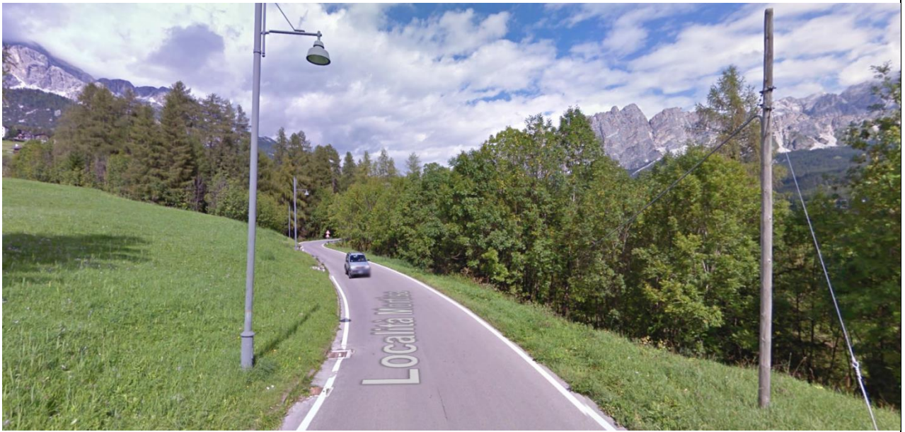
La strada da Mortisa verso Cortina