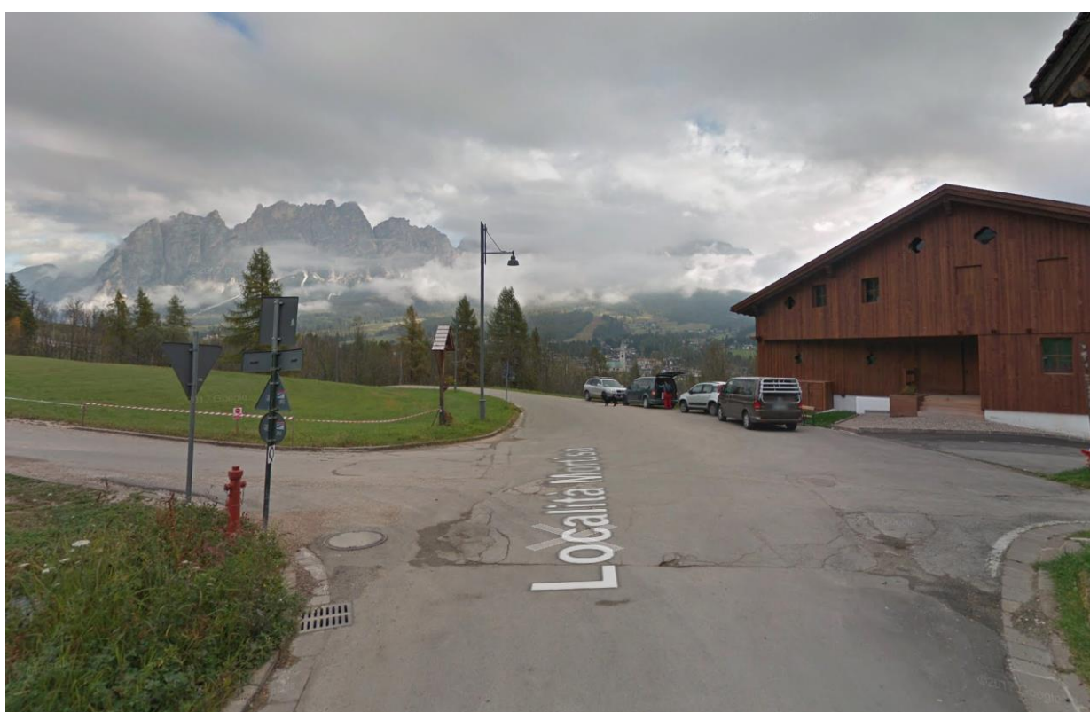
Da Mortisa a sx si sale verso Col, procedendo dritti si giunge a Cortina

QUESTA STRADA ATTUALMENTE È INTERROTTA nel punto di attraversamento del torrente ru Torgo.