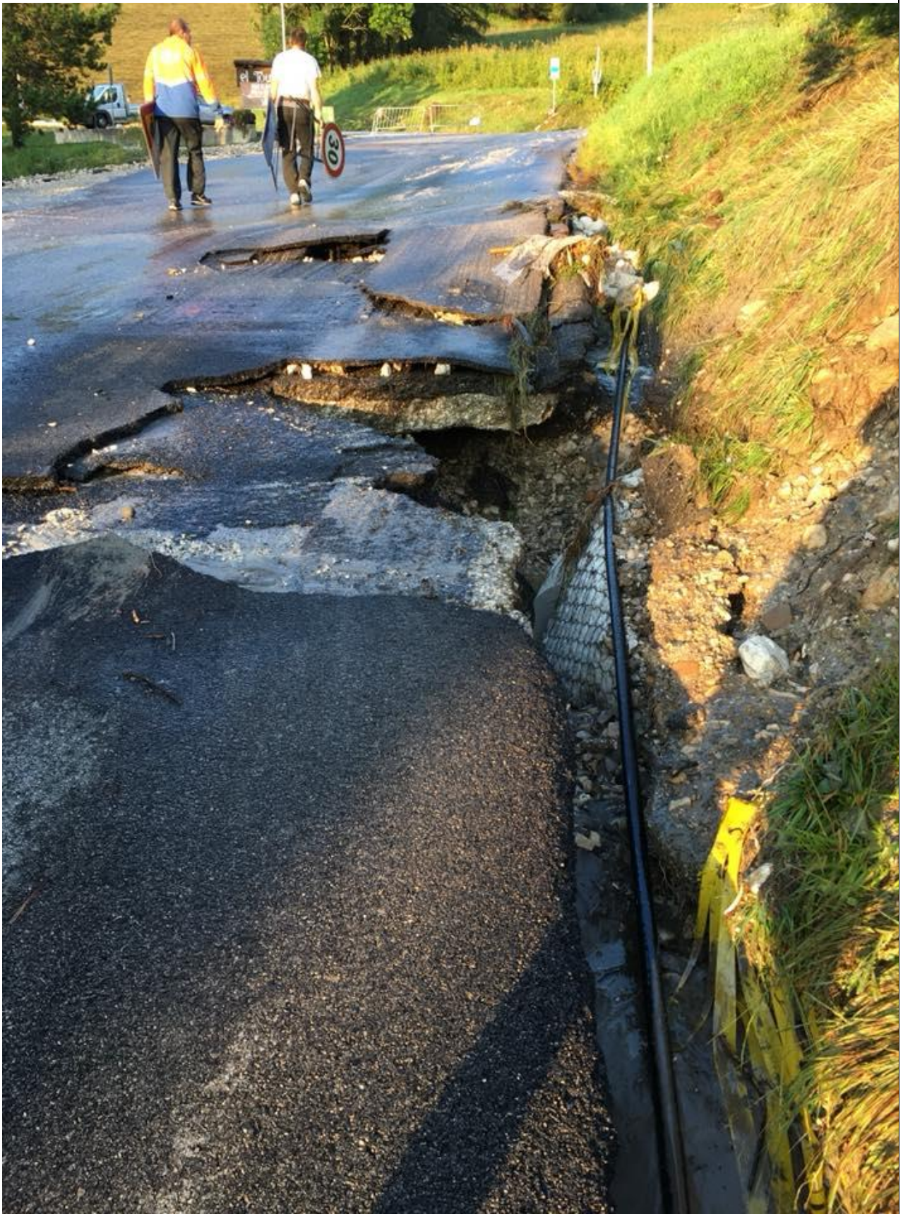
Danni alla Statale 48 delle Dolomiti