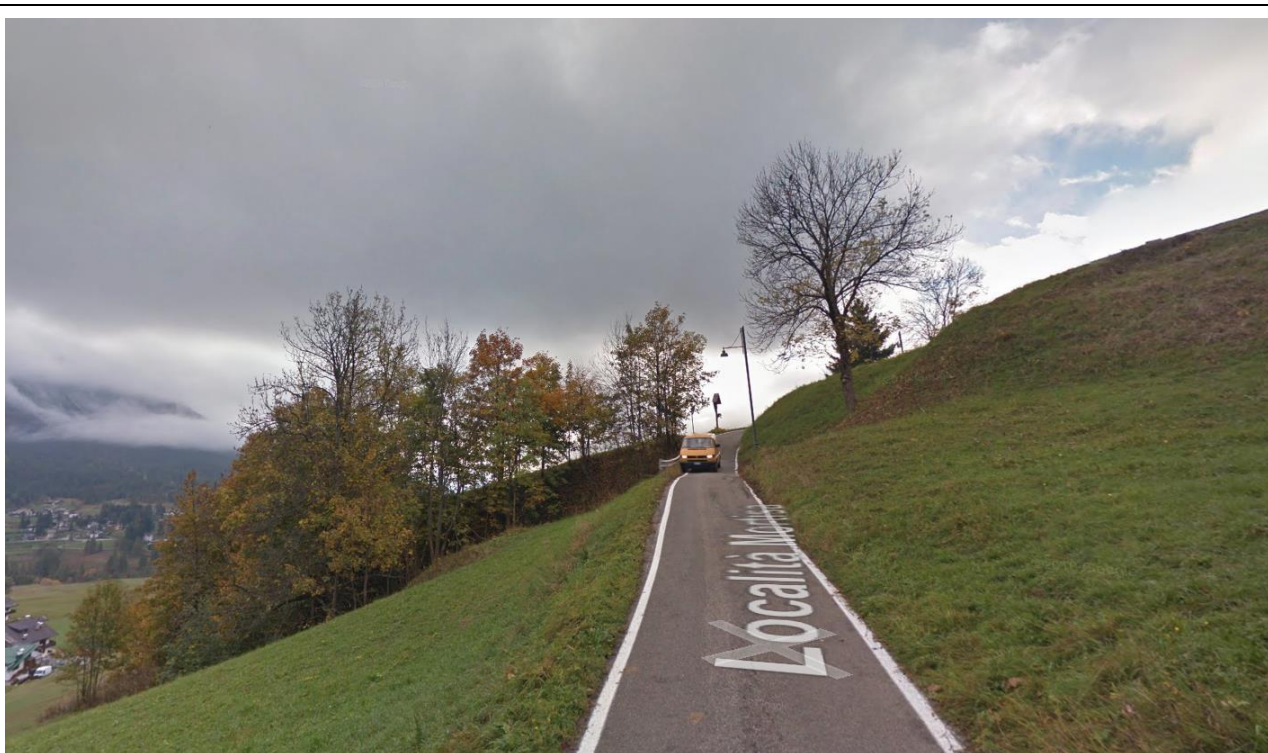
Strada comunale Mortisa -Col

Pertanto, a seguito dell'evento del 01/08/2018-02/08/2018 i villaggi di Mortisa e Col hanno rischiato di restare isolati.