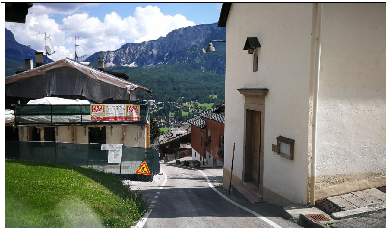
Cantiere in cento frazione di COL