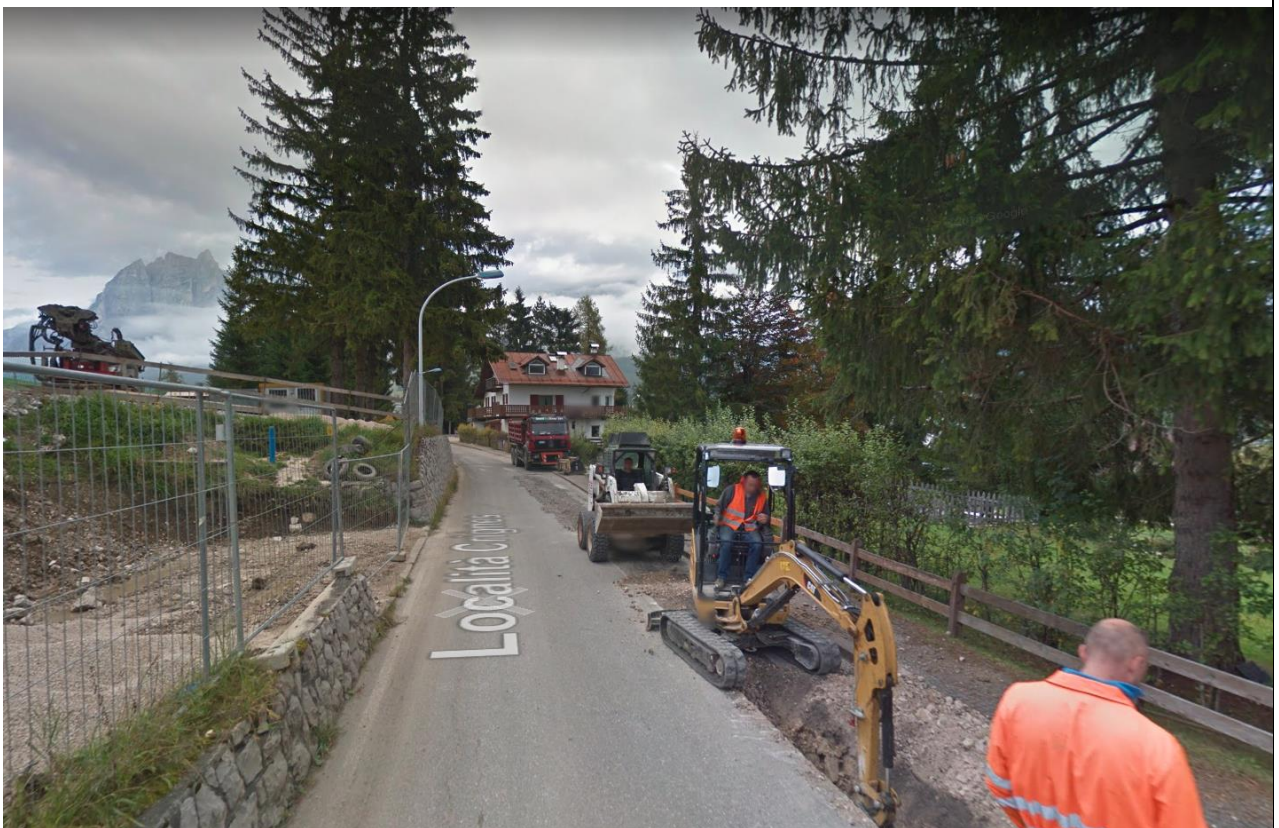
Strada da Mortisa a Cortina, tratto abitato di Crignes