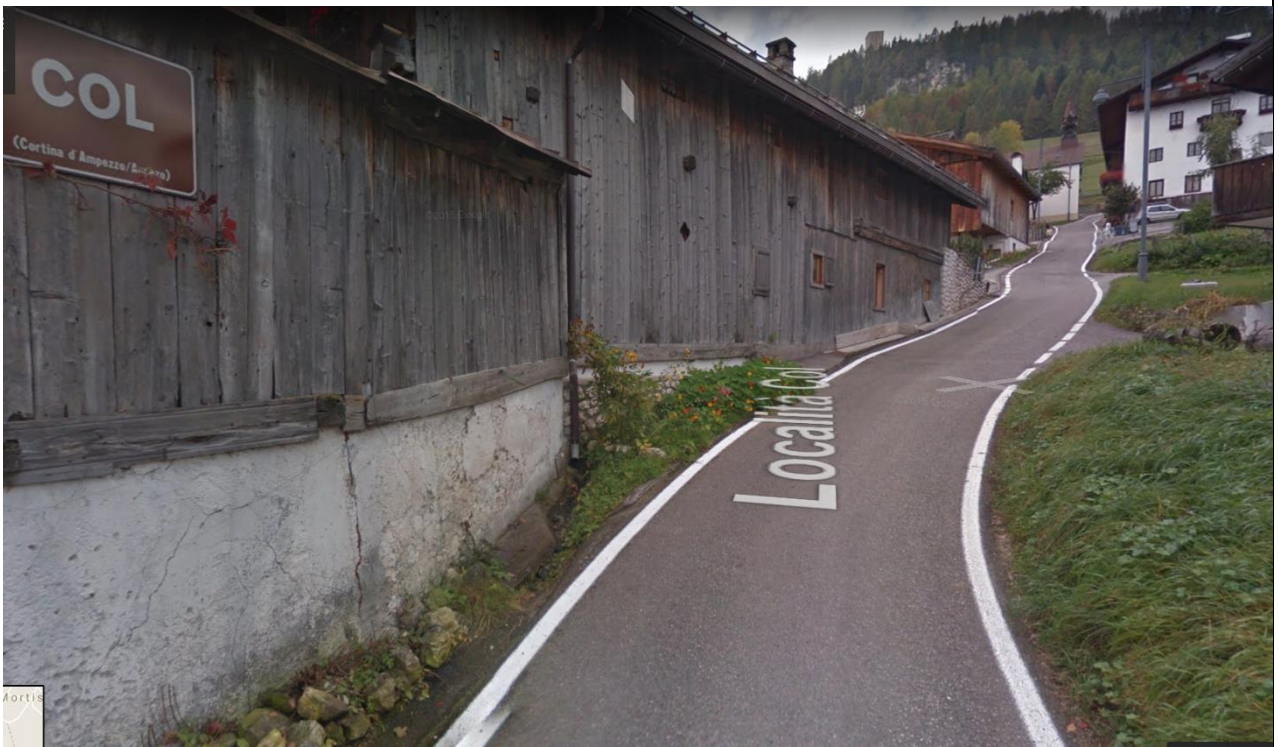
Attraversamento del Nucleo Storico di Col